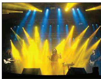
Le groupe Tithra Electric de New Delhi va faire monter la température du Club. Repro CP

La salle ruthénoise du Club continue à proposer une programmation éclectique de choix, qui balaye différents horizons musicaux, venus parfois de fort loin.