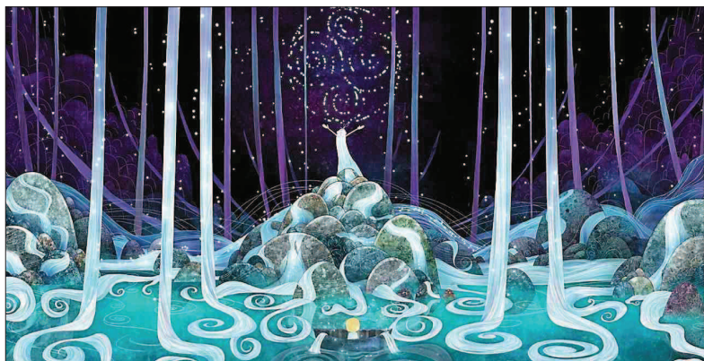
Le film d'animation « Le chant de la mer » sera projeté samedi à 15 heures à Grand-Vabre.

Plaisirs. Servi ce week-end par le centre européen de Conques et Vallon de cultures, ce festival allie programmation cinématographique et valorisation du patrimoine culinaire et des restaurants du territoire. Tous les sens sont en éveil !